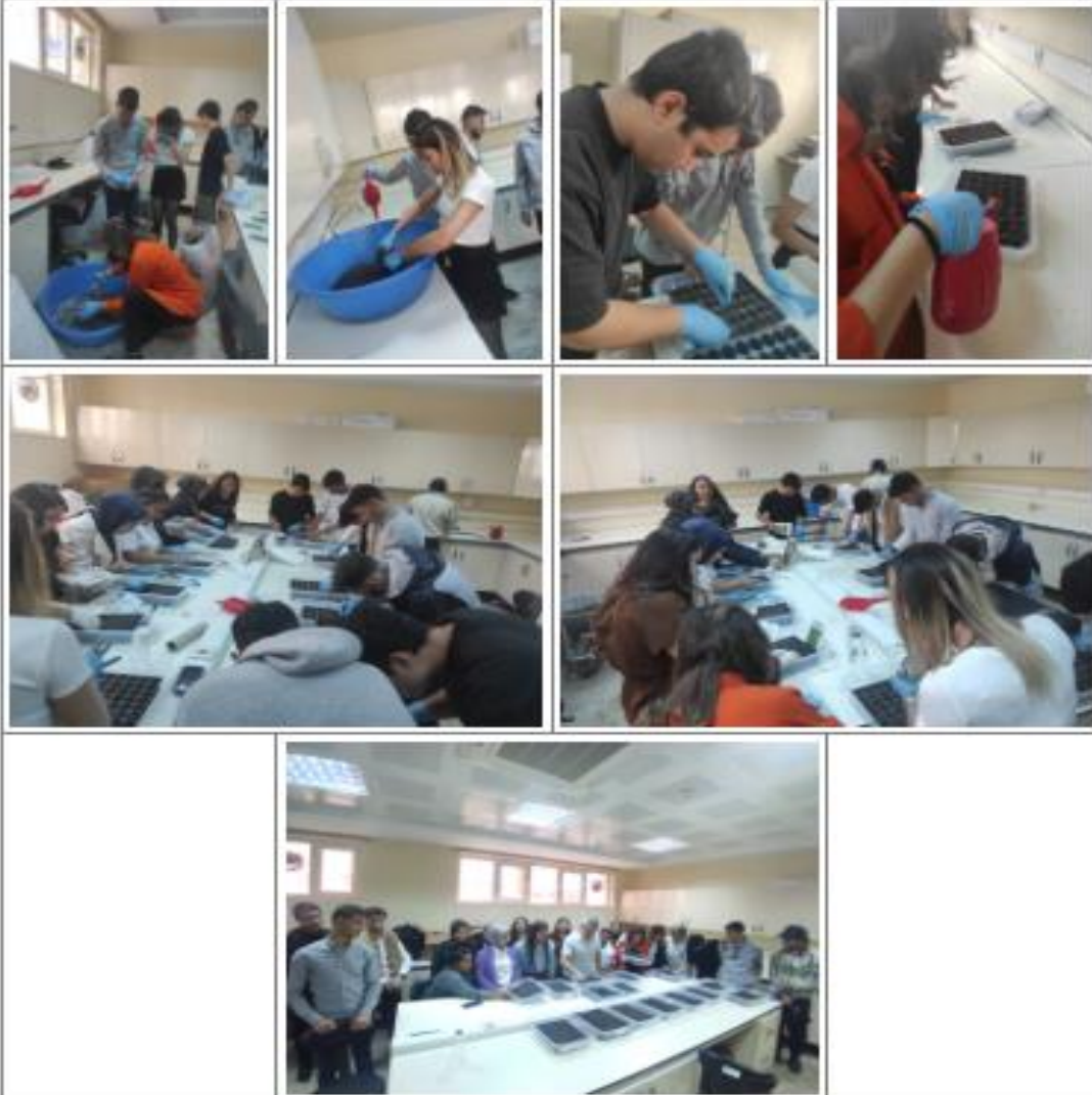
Bitkisel Üretim Laboratuvarı

Öğrenci memnuniyetini artırmak için eğitici eğitimlerinin planlanması